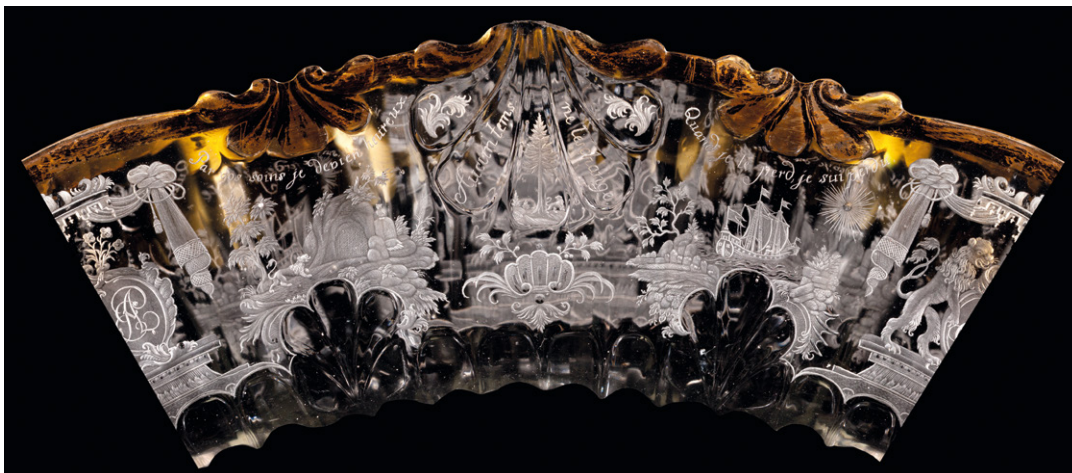
5. Samuel Schneider, puchar, Szklarska Poręba, ok. 1750–1760, fragment z dekoracją czaszy, Muzeum Karkonoskie w Jeleniej Górze, nr inw. MJG 4888/s. / Samuel Schneider, goblet, Szklarska Poręba, c. 1750–1760, detail of the decoration, Karkonosze Museum in Jelenia Góra, inv. no. MJG 4888/s.

Powyższa analiza weryfikuje również koncepcję ekspertów domu aukcyjnego Bonhams 56 , w którym został zakupiony kielich z depozytu w Zamku. Według ich ogólnej tezy dziesięć postaci kobiecych i cztery scenki w medalionach to wyobrażenia pięciu zmysłów i czterech pór roku oraz trzech cnót boskich. Jak wykazano, bezsprzecznie na szkłe przedstawiono uosobienia trzech cnót boskich oraz – co pominieli specjaliści z Bonhams – dwóch cnót kardynalnych: Męstwa i Sprawiedliwości. Z pozostałych pięciu postaci kobiecych jedynie trzy mają atrybuty alegorii pięciu zmysłów: ptak symbolizuje Dotyk, róg obfitości i kosz owoców – Smak, kobieta dotykająca palcem czoła – Wzrok. Węch natomiast musiałby uosabiać mężczyzna z fajką, a Słuch – jeleń, czyli – jak dowiedziono – motywy zdobnicze, podobnie jak polowanie i młodzieńiec w stroju antycznym z psem, które wraz z pozostałymi dwoma personifikacjami kobiecymi należałoby uznać za symboliczne wyobrażenia czterech pór roku. Ta koncepcja jest według mnie daleko idącą nadinterpretacją, gdyż wówczas byłyby przedstawione obok trzech cnót boskich tylko dwie cnoty kardynalne, a całość nie tworzyłaby spójnego programu ideowego.