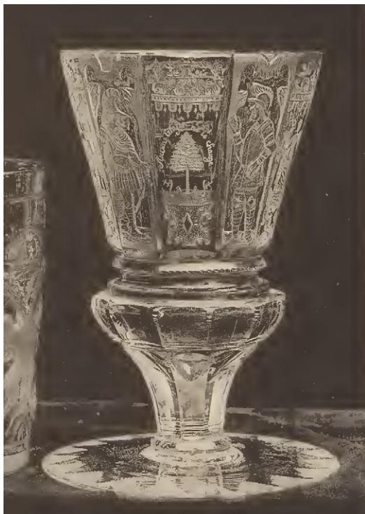
2. Pucharek, Sobieszów, ok. 1730, w: G.E. Pazaurek, Die Gläserammlung des Nordböhmischen Gewerbe-Museums in Reichenberg , Leipzig: Karl W. Hiersemann, 1902, tab. 8b. / Goblet, Sobieszów, c. 1730, in G.E. Pazaurek, Die Gläserammlung des Nordböhmischen Gewerbe-Museums in Reichenberg , Leipzig: Karl W. Hiersemann, 1902, Pl. 8b.

Wśród omawianych szkielek należy wyróżnić trzy zabytki, powstałe ok. 1730 r., o najbardziej rozbudowanej symbolicznej dekoracji, wykonanej według jednego wzorca i wykazującej bardzo duże zbieżności opracowania artystycznego. Są to: pucharek opublikowany przez Pazaurka w 1902 r. 47 (il. 2), kielich ze zbiorów Museum August Kestner w Hanowerze 48 oraz kielich pochodzący z kolekcji Horsta Mühleiba, obecnie w depozycie The Ciechanowiecki Foundation „The Charity” w Zamku Królewskim w Warszawie (który ma nieautentyczne, choć z epoki, część trzonu ze stopą i pokrywą, il. 3) 49 . Dekoracja pierw-