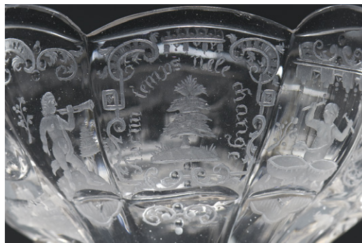
1. Czarka na cukry, Cieplice, l. 40. XVIII w., fragmenty, Zamek Królewski w Warszawie – Muzeum, nr inw. ZKW/230. Fot. A. Ring, L. Sandzewicz / Sugar bowl, Cieplice, 1740s, details, Royal Castle in Warsaw – Museum, inv. no. ZKW/230. Photo A. Ring, L. Sandzewicz

Baschwitz 19 , które można uważać za przedstawienie jednej z siedzib rodu, podobnie jak wyobrażenie rezydencji podpisanej Wasserschloss na kielichu z kolekcji Corning Museum of Glass 20 . Chwałę Schaffgotschów niewątpliwie mają głosić putta z instrumentami flankujące z dwóch stron emblemat z dewizą dekorujące pucharki i czarki na cukry z lat 1730–1735 znajdujące się w kolekcjach Zamku Królewskiego w Warszawie – Muzeum, Glasmuseum Passau i Uměleckoprůmyslového museum w Pradze 21 . Ponadto na obiekcie z Passau rozdzielają one wyobrażenie zamku Chojnik 22 , a na szkłe z praskiego muzeum 23 – miniaturowe scenki rodzajowe rozgrywające się na tle natury. Sceny rodzajowe na tle krajobrazu, takie jak sielanka czy koncert w parku 24 , pejzaże 25 , polowania, niekiedy umieszczone po dwa na jednym naczyniu 26 , uznać należy za typowe dla szkła śląskich motywy dekoracyjne, wzorowane na grafice. W ten sposób powinno się również potraktować swoistą chinoiserie – scenki chińskie otoczone rokokowymi ornamentami obramowujące emblemat Schaffgotschów na pucharu powstałym ok. 1760 r. w pracowni Ch.G. Schneidera, znajdującym się w zbiorach Muzeum Narodowego we Wrocławiu 27 . Są one