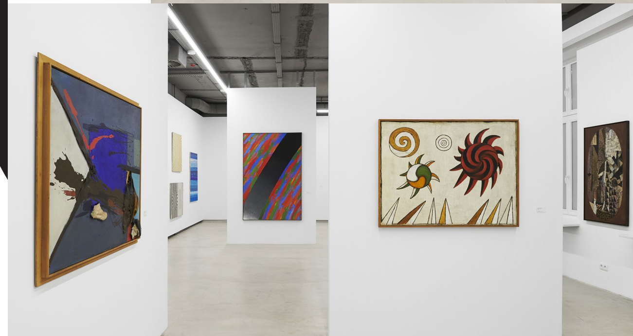
➤ PO LEWEJ: PRACA BRONISŁAWA KIERZKOWSKIEGO, POŚRODKU: TRZY KOMPOZYCJE MARIANA BOGUSZA, PO PRAWEJ: DWA OBRAZY STEFANA GIEROWSKIEGO.