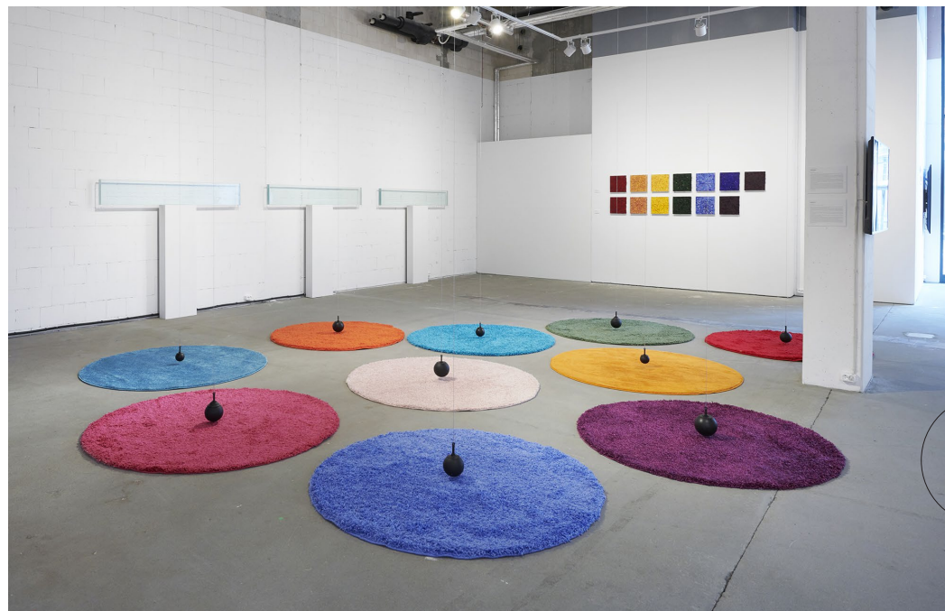
↓ NA DALSZYM PLANIE, OD LEWEJ, WYEKSPONOWANE NA ŚCIANACH PRACE JAROSŁAWA PERSZKO I PAWŁA NOWAKA. NA PIERWSZYM PLANIE PRACE RYSZARDA ŁUGOWSKIEGO. FOT. A. GUT. DZIĘKI UPRZEJMOŚCI GALERII SALON AKADEMII