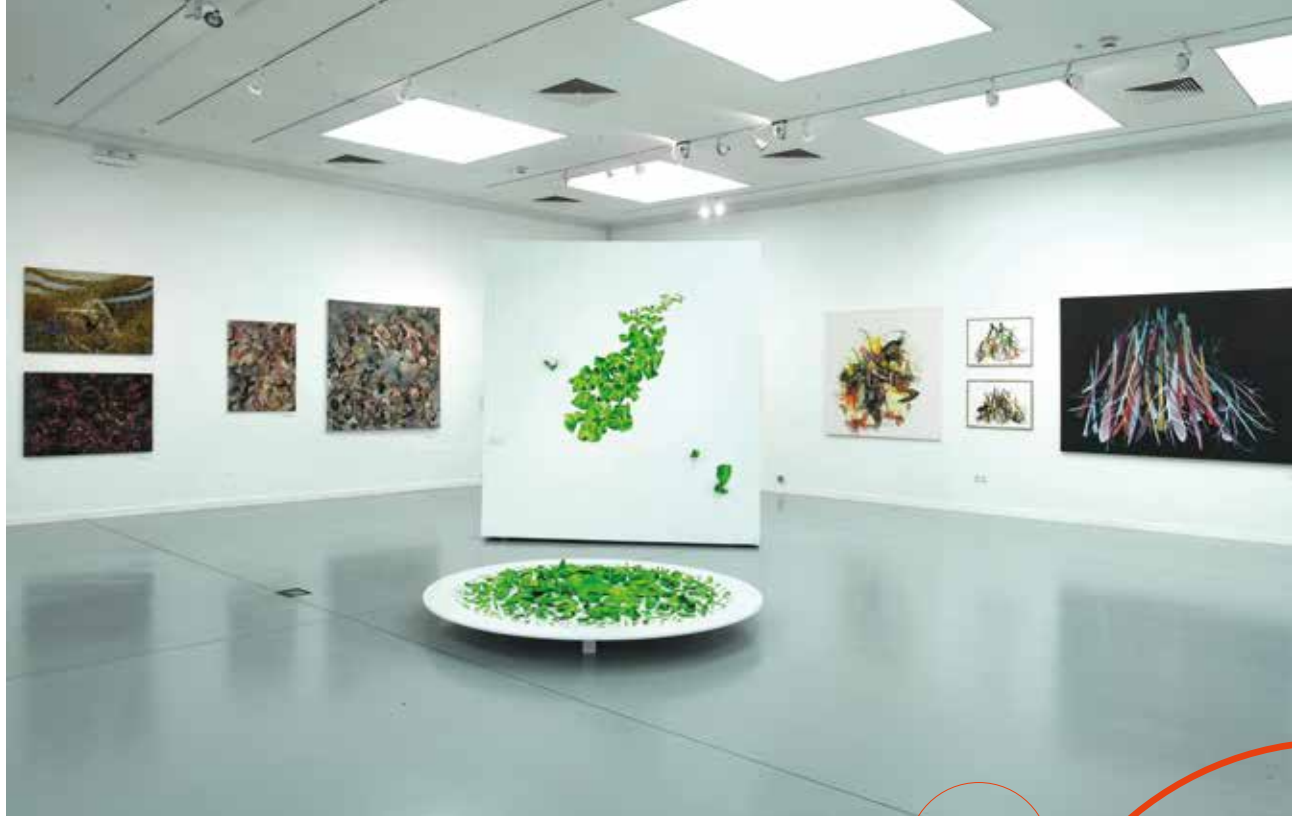
↑ HERBARIUM NOVUM. EFFLORESCENTIAE.