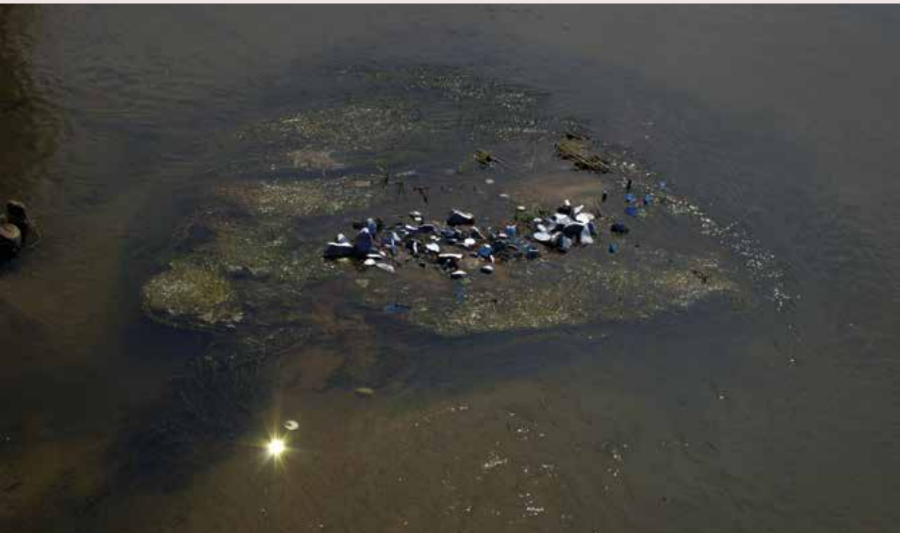
♦ KINGA ZAGAJEWSKA, MIGOTY, INSTALACJA NA PŁYCIŹNIE WARTY. MIĘDZYNARODOWY FESTIWAL SZTUKI ULOTNEJ W UNIEJOWIE, 2019.