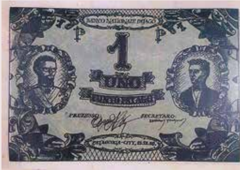
♦ MICHAŁ ZAJĄCZKOWSKI, FUNT PATAGOŃSKI Z 1958 ROKU O WARTOŚCI BRAKU 100 ŻŁOTYCH NA WYSTAWIE SENSIBILISTÓW W WARSZAWSKIEJ GALERII DZIAŁAŃ. FOT. J. RYLKE, 2017