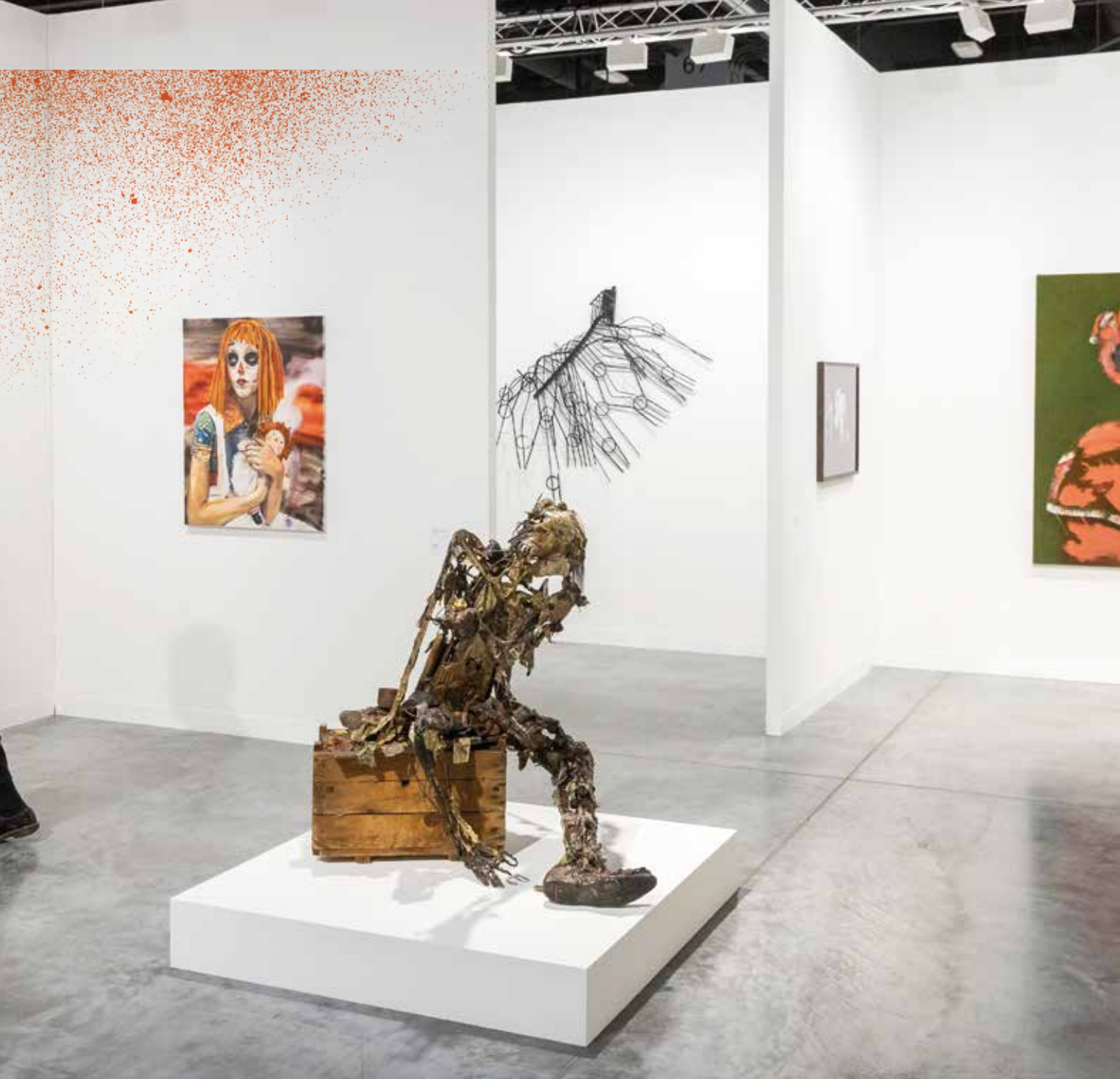
♦ ART BASEL MIAMI BEACH, GALERIA, FOKSAL GALLERY FOUNDATION.