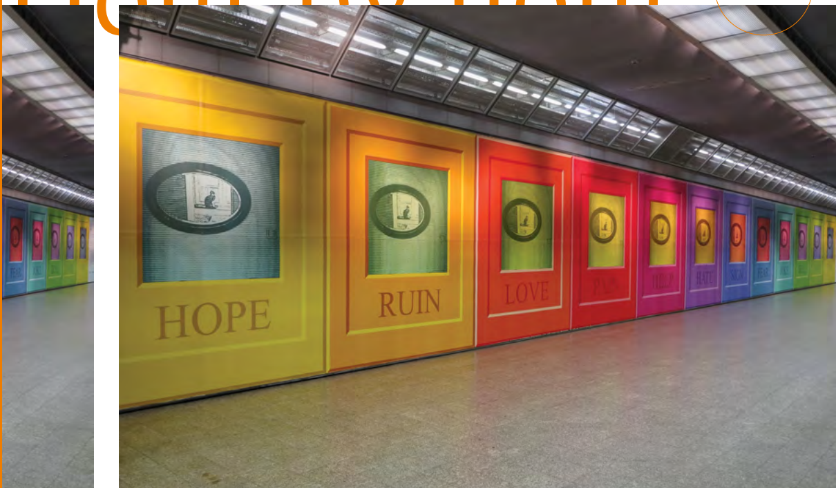
↑ ARKADIUSZ KARAPUDA, HOURLY BY HOURLY .