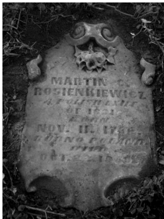
Ryc. 1. Marcin Rosienkiewicz, płyta nagrobna