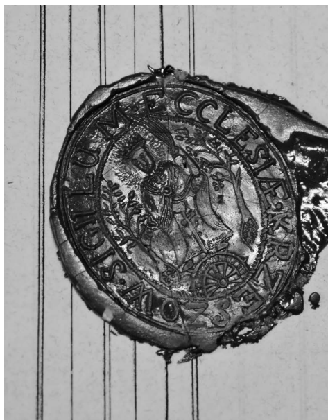
Ryc. 4. Odcisk pieczęci w bordowym laku, dawny kościół pw. św. Katarzyny Aleksandryjskiej w Krzeszowie, AKKM, Copiae Copulatorum Parochiae Krzeszów , 12 stycznia 1886