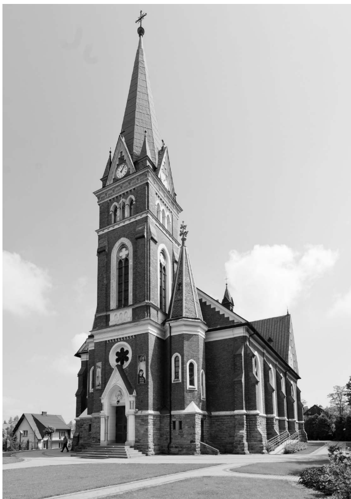
Ryc. 10. Świątynia pw. Matki Boskiej Nieustającej Pomocy w Krzeszowie, 1903 r., widok od pd. – zach.