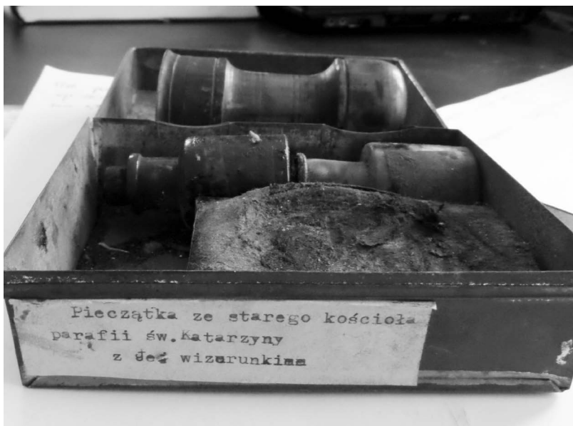
Ryc. 2. Pudełko na stempel tuszowy z dawnego kościoła parafialnego pw. św. Katarzyny Aleksandryjskiej w Krzeszowie