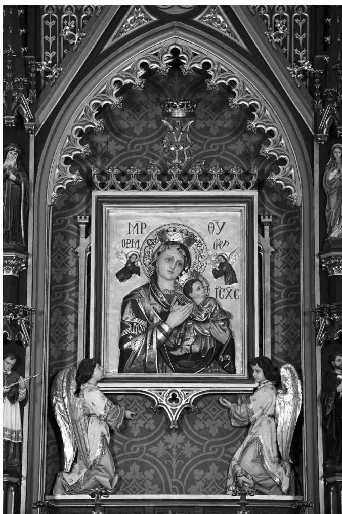
Ryc. 11. Kopia ikony Matki Boskiej Nieustającej Pomocy w ołtarzu głównym w świątyni pw. Matki Boskiej Nieustającej Pomocy w Krzeszowie, po 1903 r.