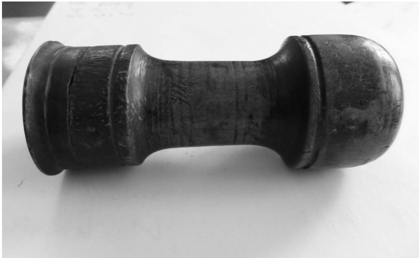
Ryc. 1. Tłok pieczętny z dawnego kościoła pw. św. Katarzyny Aleksandryjskiej w Krzeszowie, widok ogólny