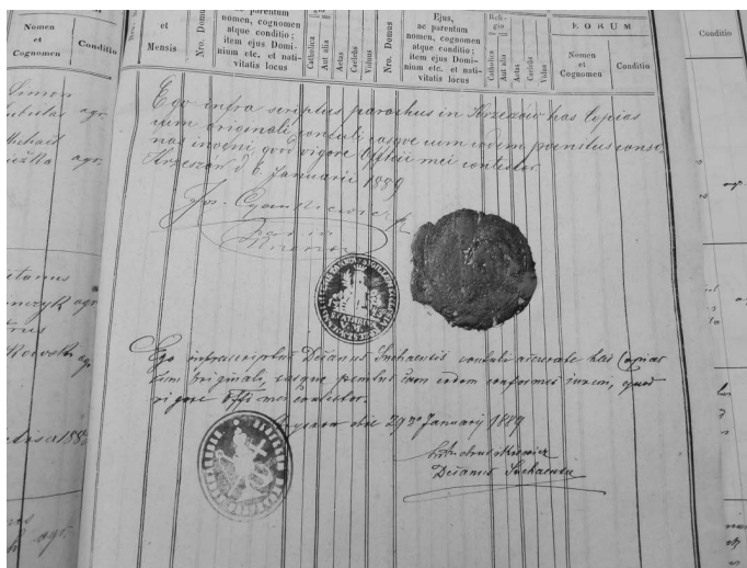
Ryc. 8. Odcisk pieczęci w bordowym laku i granatowym tuszu, dawny kościół pw. św. Katarzyny Aleksandryjskiej w Krzeszowie oraz odcisk pieczęci dekanatu makowskiego w czarnym tuszu, AKKM, Copiae Natorum Parochiae Krzeszów, 29 stycznia 1889 r.