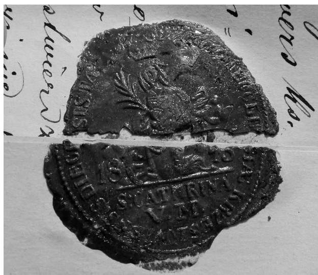
Ryc. 6. Odcisk pieczęci w bordowym laku, dawny kościół pw. św. Katarzyny Aleksandryjskiej w Krzeszowie, AKKM, APA 166 Krzeszów, Korespondencja z Konsystorzem Biskupim w Tarnowie , 12 marca 1879 r.6