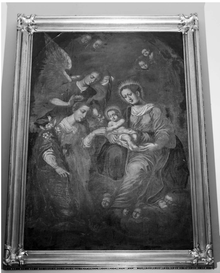
Ryc. 9. Obraz Mistyczne Zaślubiny św. Katarzyny , olej na płótnie, 1663 r., dawny kościół pw. św. Katarzyny Aleksandryjskiej w Krzeszowie