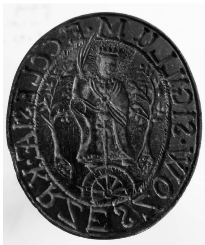
Ryc. 3. Awers tłoka pieczętnego z dawnego kościoła pw. św. Katarzyny Aleksandryjskiej w Krzeszowie